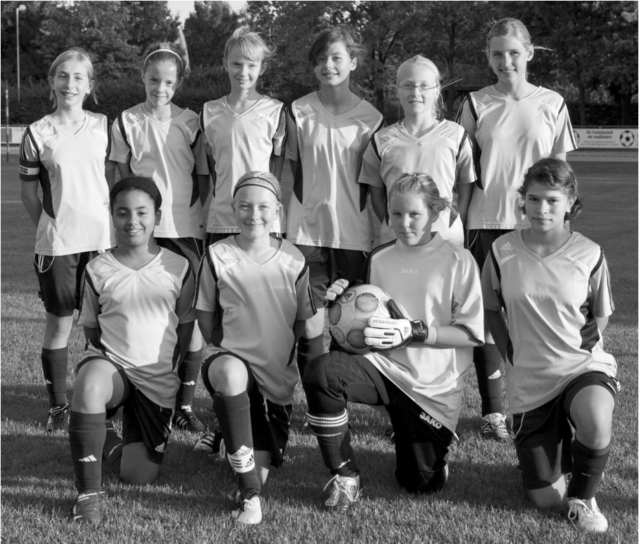
Die U12/1-Mädchen vor dem Spiel gegen die SG Bornheim auf dem Hauptfeld der SGE