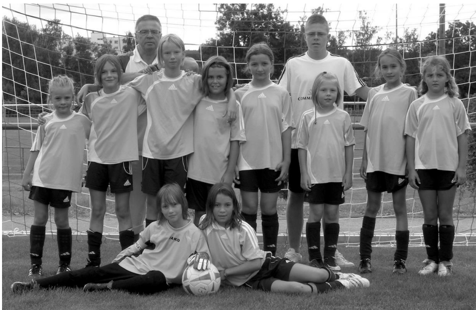
Die U10 Mädchen nach ihrem ersten Spiel in Oberdorffelden