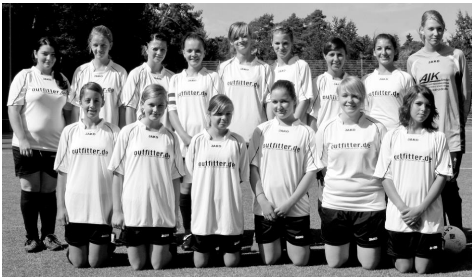
Die U16 spielt bereits in der Regionalliga Süd

spielen. Der Kader von derzeit 16 Spielerinnen ist für die lange Saison mit 24 Spielen etwas dünn. Gerne werden deshalb noch Mädchen des Jahrganges 93/94 aufgenommen. Kommt doch einfach vorbei und habt Spaß am Fußball!