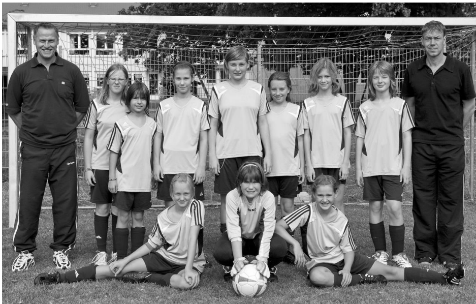
Die U12/2-Mädchen halten in dieser Saison tapfer dagegen