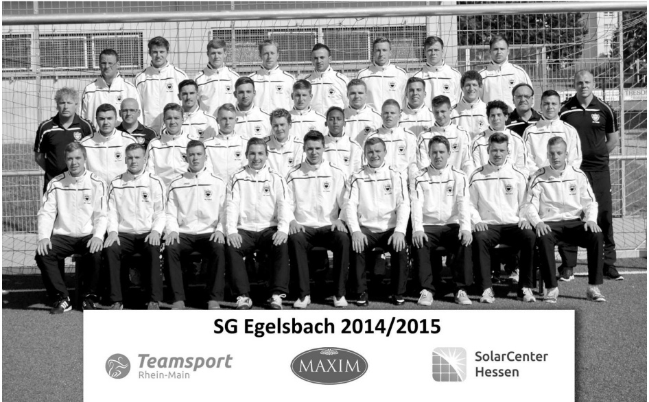
SG Egelsbach 2014/2015

Die erste und zweite Mannschaft der Abteilung Fußball wurde für die aktuelle Saison mit neuen Trainingsanzügen ausgestattet. Hierfür bedanken wir uns bei TeamSport Rhein Main, dem Solar Center Hessen und der Bäckerei Cafe Maxim.